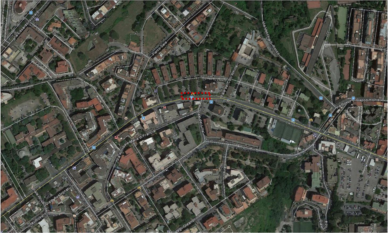
Figura 1 Individuazione dell'area